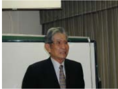
ご挨拶される古川会長