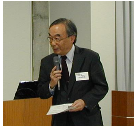
佐治先生のご挨拶