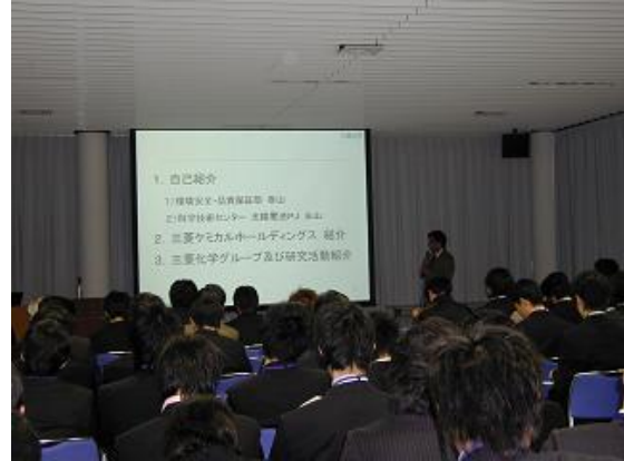
M社卒業生の話題提供