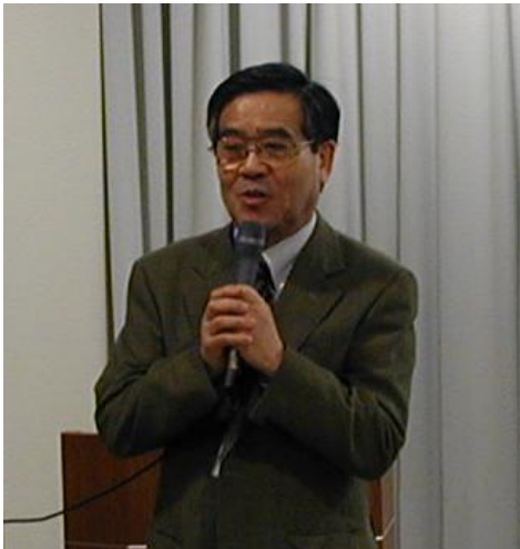
中井先生の乾杯のご挨拶