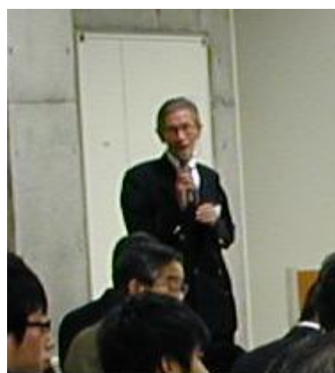
高木副会長の司会