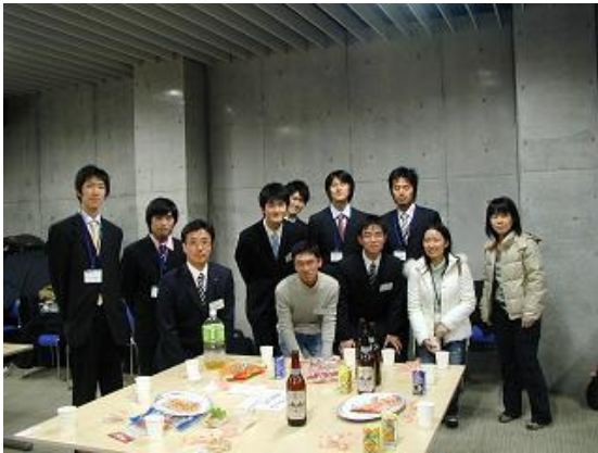
F社卒業生と学生の懇談