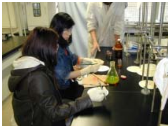
発光物質作ろう そしてお絵描きを