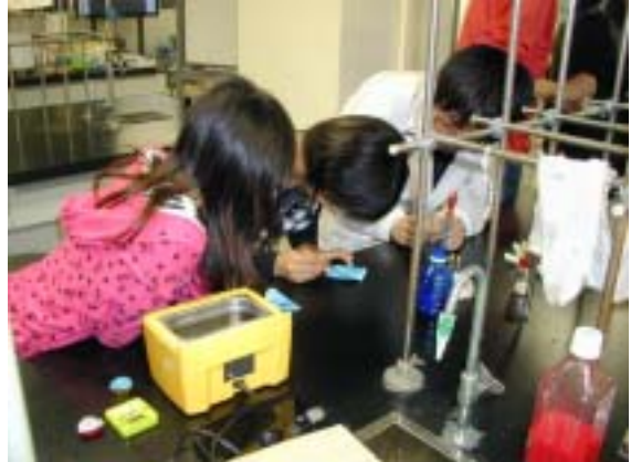
ラメに色をつけよう