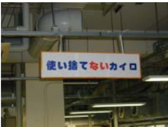
過冷却を活用した使い捨てないカイロ