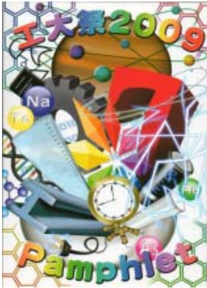
工大祭 2009 パンフレット