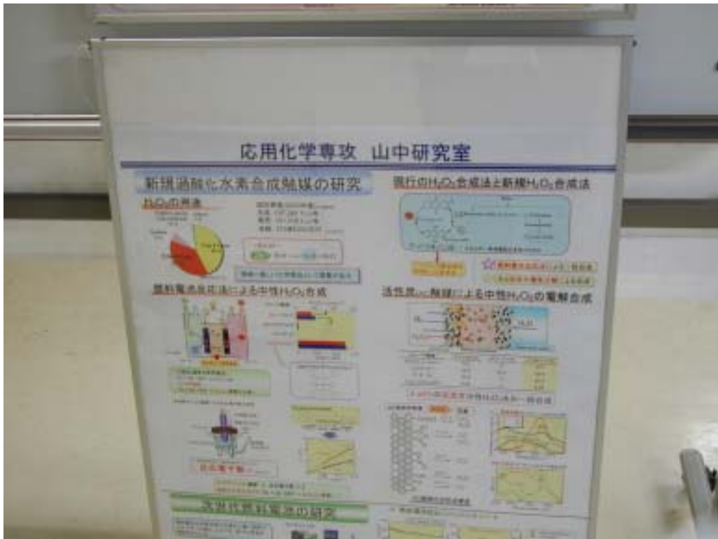
山中研究室 ポスターの一部