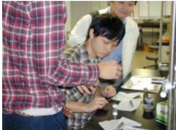
燃料電池の電極作成