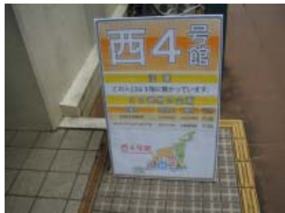
なるほど応用化学 会場入口