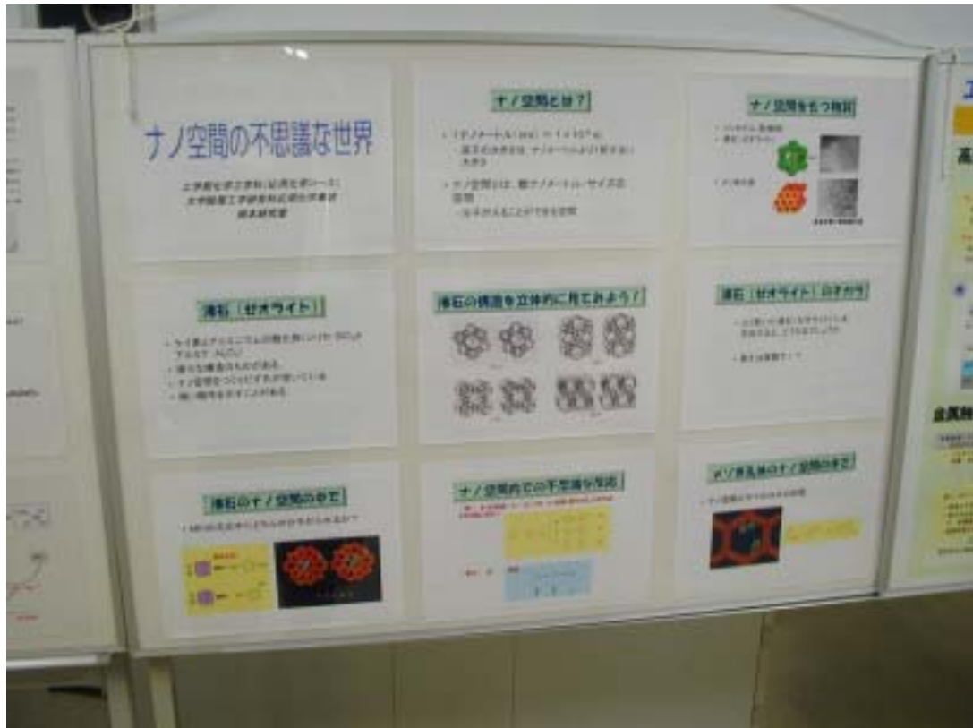
岡本研究室 ポスターの一部