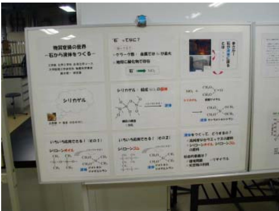
鈴木(栄)研究室 ポスターの一部