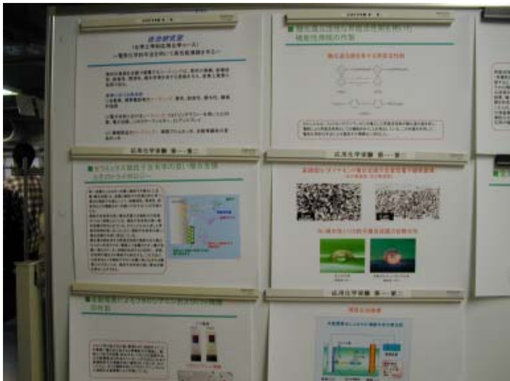
佐治研究室 ポスターの一部