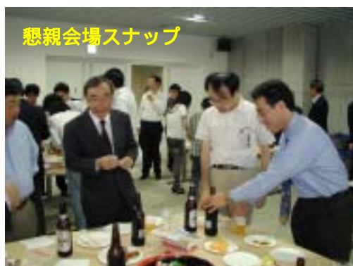
懇親会場スナップ