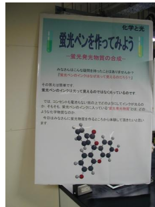
蛍光ペンを作ってみよう