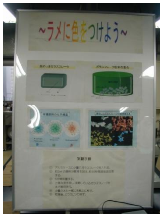
ラメに色をつけよう解説パネル