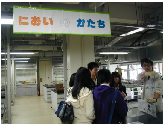
においのかたちコーナー