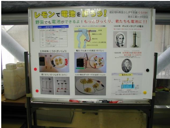
レモン電池の解説パネル