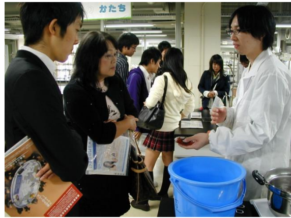
使い捨てないカイロの説明