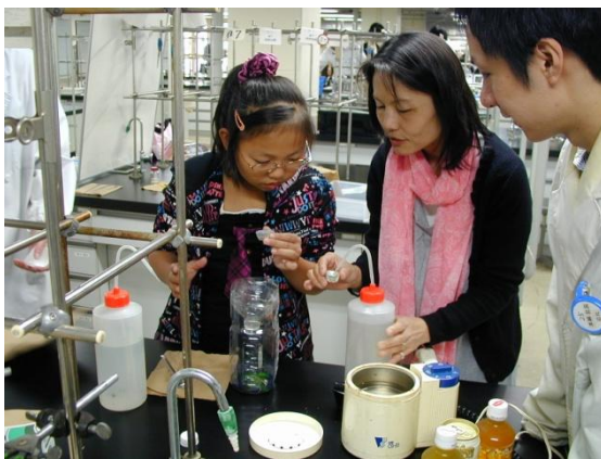
ラメに色をつけよう実験