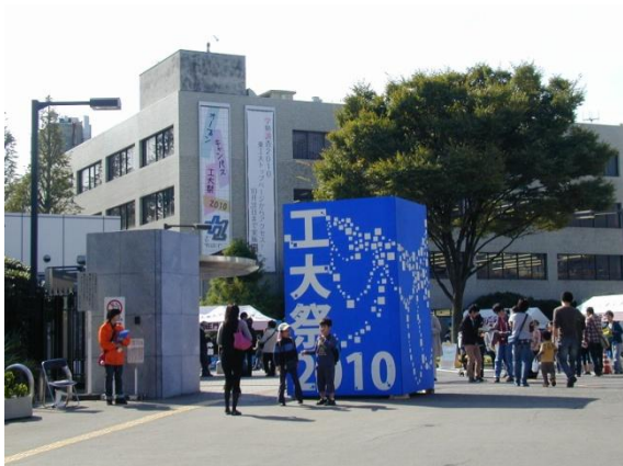
正門の工大祭看板

10月23日、24日大岡山キャンパスで工大祭が開催された。公式パンフレットにあるように、今年のテーマは「プラス-1」であり、応用化学コースの来校者参加型プログラムに於いても(1) 蛍光ペンを作ってみよう、(2) ラメに色を付けよう、(3) 使い捨てないカイロ、(4) においのかたち、に加えクラリカのご協力を得て(5) レモン電池の試作実験を行った。いずれのプログラムも盛況であった。