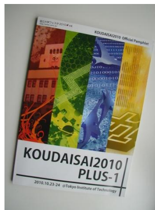
工大祭公式パンフレット