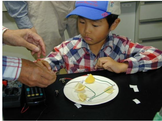
レモン電池の制作実験