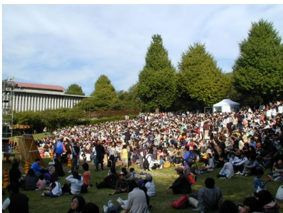
野外ステージの観客