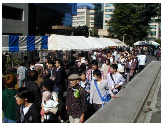
模擬店のにぎわい