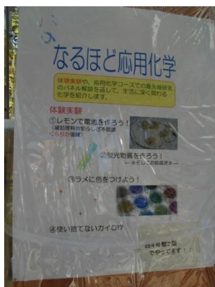
応用化学研究室紹介の案内板