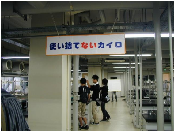
使い捨てないカイロコーナー