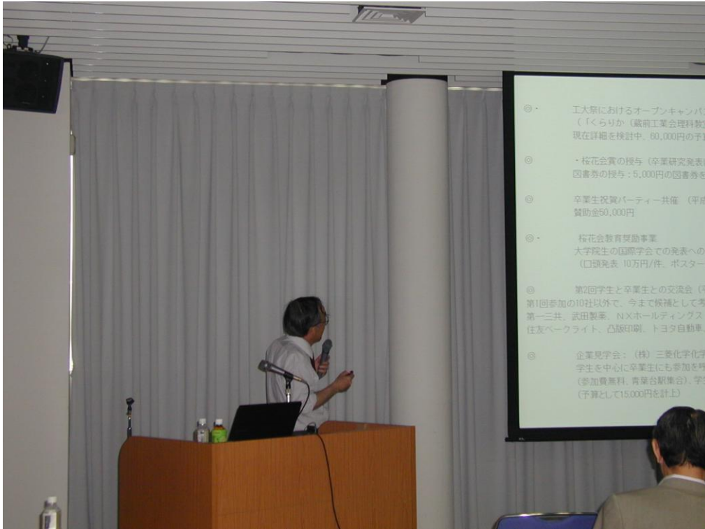
佐治先生による事業報告