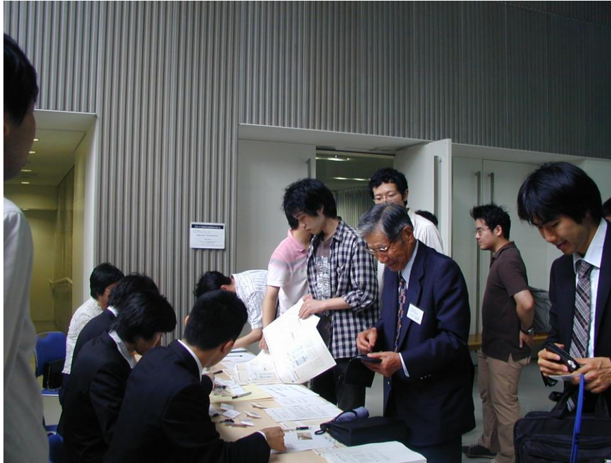
総会・講演会・懇親会受付風景 1