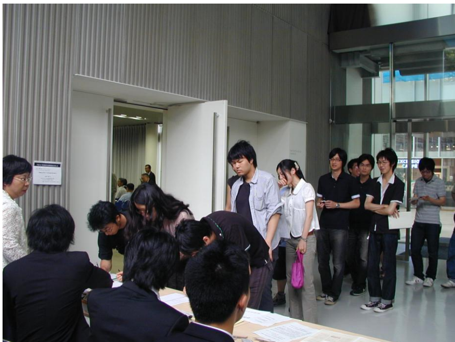
総会・講演会・懇親会受付風景 2