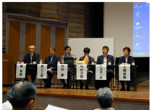
パネルディスカッションのパネラー