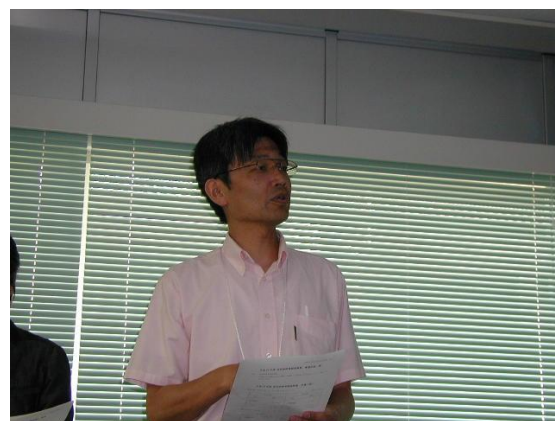
報告される岡本H24年会計幹事