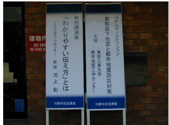
講堂前のイベント表示