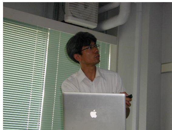
報告される田中H23年会計幹事