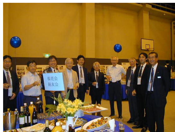
全体交流会会場の桜花会会員