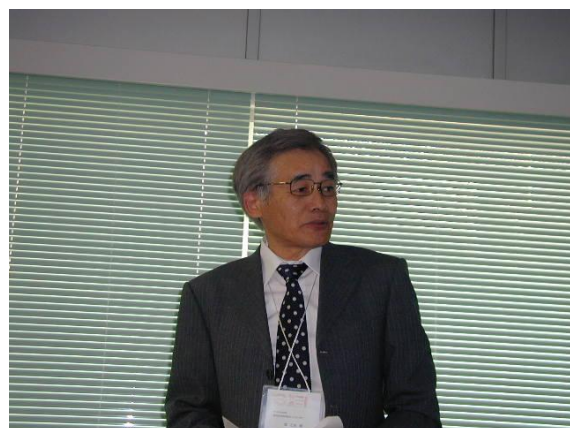
監査報告されるH23年会計監事