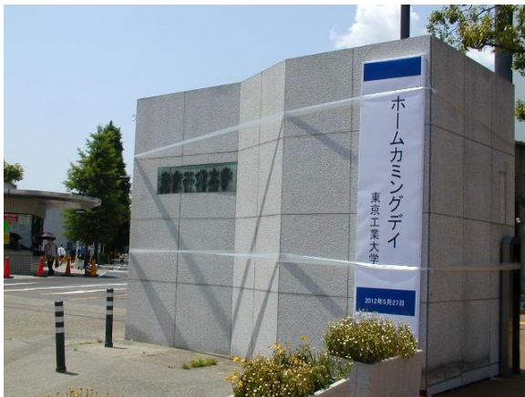
正門前のホームカミングデイの表示