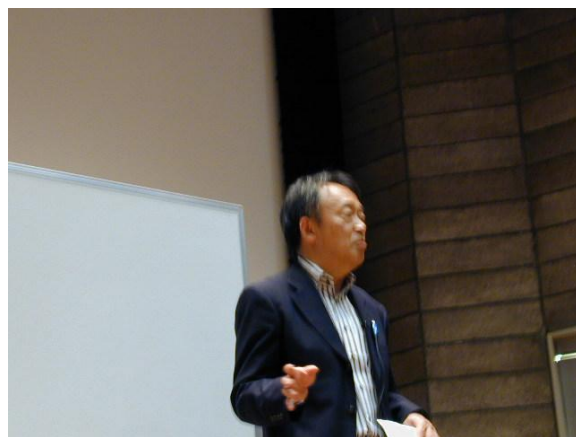
特別講演をされる池上彰教授