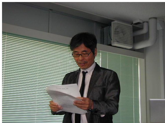
報告される和田H23年庶務幹事