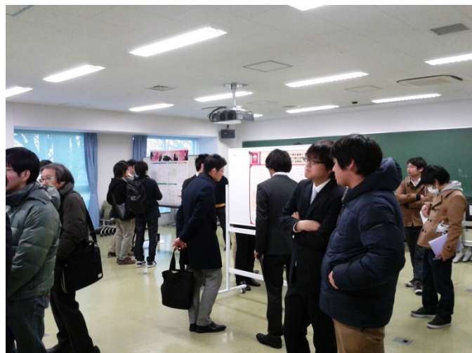
ポスターセッション風景