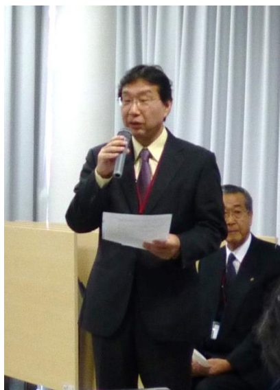
岩倉副会長総合司会