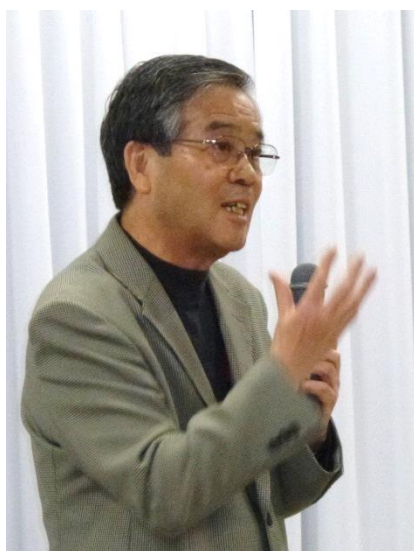
中井名誉教授(副会長)挨拶