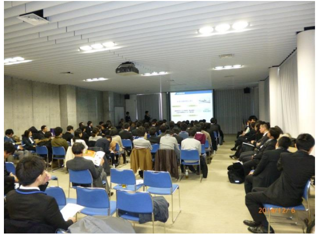
卒業生の体験談報告会場