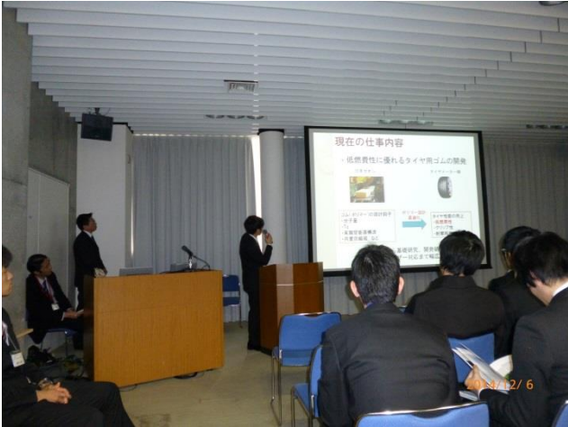
各社の卒業生のお話し