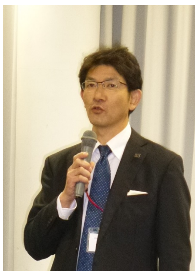
大友教授(常任幹事)懇親会挨拶