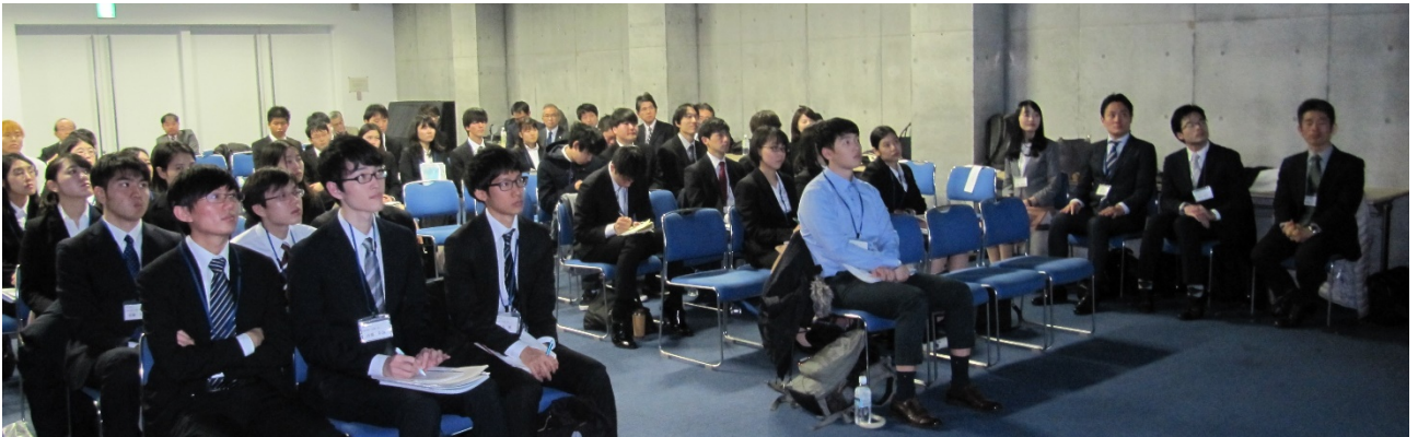
話題提供の会場風景