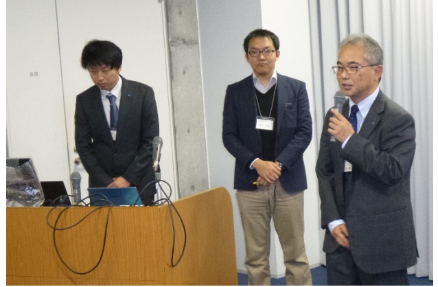
卒業生からの話題提供