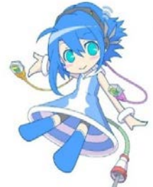
工大祭マスコット テックちゃん ©工大祭実行委/ヒダ