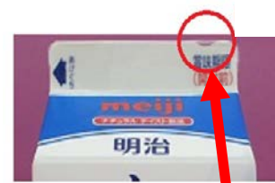
牛乳パックの切り欠き