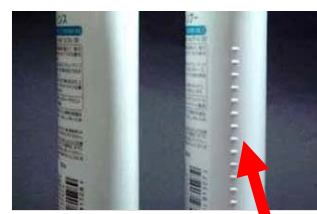
シャンプー容器側面の凹凸